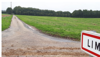
Au bout du chemin goudronné la Vue sur le château